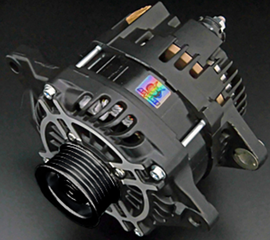
ハイエフェンシーオルタネーター

重量：約 6.5 kg 出力：12V / 130A 仕様：クラッチプーリー / 従来型コイル