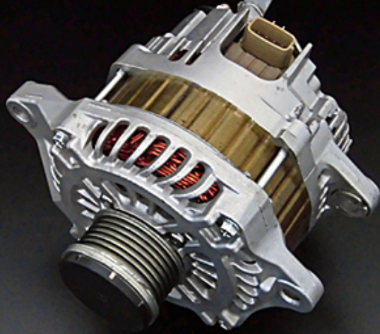
ノーマル (純正) オルタネーター

重量：約 6.5 kg 出力：12V / 130A 仕様：クラッチプーリー / 従来型コイル