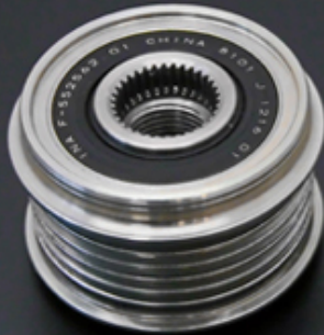
クラッチプーリー

重量：約 5.7 kg 出力：12V / 150A 仕様：クラッチレスプーリー / 新型9G用コイル